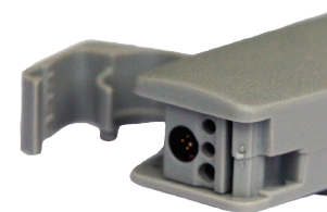
На рисунке: Sophono® Alpha 2 MPO™ с максимальной выходной мощностью 120 дБ

Полностью программируемая цифровая слуховая система, имеющая следующие характеристики: