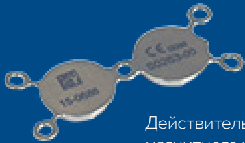
Действительный размер магнитного импланта